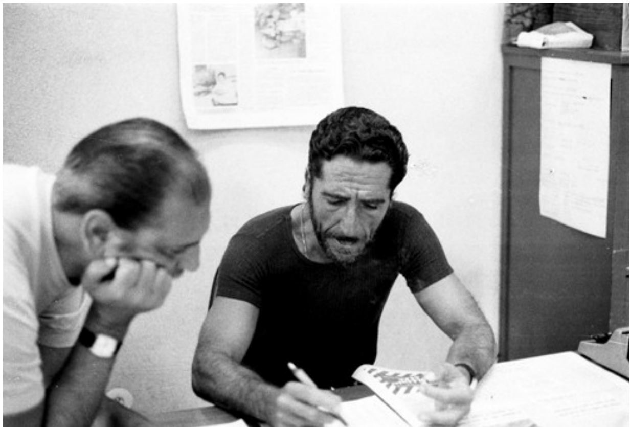
Pippo Fava , intellettuale, romanziere, giornalista, ucciso da Cosa nostra a Catania il 5 gennaio 1984